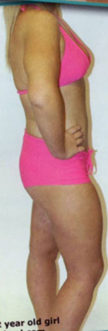
Liposuction on 12 year old girl www.makemeheal.com